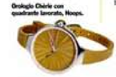
Orologio Chérie con quadrante lavorato, Hoop.

Giove dissonante mette uno i riflettori ciò che non ti va più bene. Ma il lungo transito di Marte nel tuo segno (fino a luglio!) ti dà la grinta necessaria per superare le indecisioni procrastinabili e le distriche da risolvere. La fatica la mascheri dietro al musco. Questioni di cuore Il partner vorrebbe alleggerirti, distrarti dal peso della quotidianità. Vorrebbe scaldarti il cuore, e invece ti immiserisce. Se sei single le new entry promettono amori passionali, ma precari.