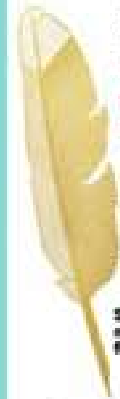
Segnalibro per non perdere il filo, Tom Dixon.

Umori altalenanti e malinconie che arrivano all'improvviso come le nuvole dei cieli della Bretagna. Vero il periodo non è dei migliori, con Saturno che ti guarda come un genitorino e ti fa sentire con le mani legate. Ma tu sai come sollevarti. Marte in trigono della Bilancia mette a disposizione un sacco di energia. Questioni di cuore Se lo abbracci, quella passione speciale sembra svanita. Le single sono distratte (da soldi e lavoro). Venere non le induce in tentazione e così settimanali per strada i più volenterosi corteggiatori.