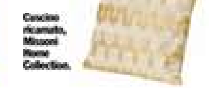
Cuscino ricamato, Missoni Home Collection.

Il pesante Saturno ha fatto le valigie dalla prima decade, ma continua a fare lo sgambetto alle nate in maggio, facendo venire al petto problemi rimossi (sentimentali o professionali, dipende dal tema natale) che chiedono un chiarimento definitivo. Questioni di cuore Al trigono di Venere non si sfugge! Vietano poltrone a casa sul divano guardando le serie tv preferite. Battuti tra le braccia di uno Scorpione o Capricorno. Indossa gli abiti più sexy che hai lasciato chiusi per troppo tempo nell'armadio.