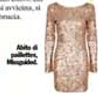
Abito di pallottole, Missoni.

Con Saturno nel segno stai costruendo pareti interiori più solide. E stai eliminando quello che non ti serve più per fare posto al nuovo. Questioni di cuore Niente più sindromi abbondanti e gelosie. Senza accorgertene, ti ritrovi in qualcosa di più dolce e armonioso. Saturno (ancora lui!) mette alla prova il rapporto: se è vero Amore, supererà il test. Le single sono pronte a lasciarsi come un falò estivo: chi si avvicina, si brucia.