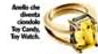
Avviso che diventa cioccolato Toy Candy, Toy Watch.

Wow, la signora pisciolina scende sulla terra! Stai diventando brava a convivere con il grande Saturno che ti insegna a essere concreta e determinata e a mollare il superfluo. Hal compilate la tua lista dei desideri? Giove generoso è pronto a esaudirti. Questioni di cuore Tu che solitamente ti innamorati in volo al giorno, ti ritrovi a progettare lo scambino di anelli o la coesistenza. In una parola: la stabilità. Lui ti strama. Vi strama. Le single scivolano nel dolce mare degli incontri (anche nascosti!).