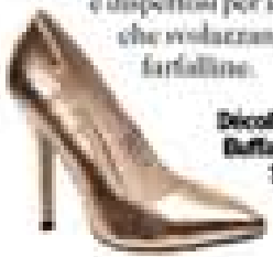
Decolletés Buffalo viste su Sarenza.it

E vai! L'inizio è molto energetico e produttivo. Cerca di sbattere al meglio Marte in Bilancia (fino a luglio 2014): si tratta di un momento irripetibile. Probabilmente qualcuno sul lavoro ti farà una proposta interessante che non potrai rifiutare. Questioni di cuore Forse il partner non ti può dare tutta l'attenzione che pretendi. E chiede, invece, il tuo supporto. Non c'è bisogno che ti metti a piangere con lui: basta lasciarlo parlare. E ascoltarlo. Fletti distratti e dispettosi per le single che volizzano come farfalline.