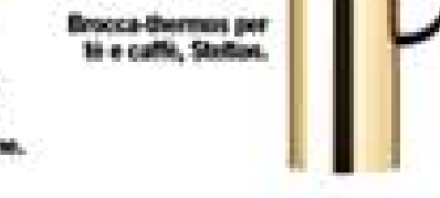
Brocca-thermos per tè e caffè, Stelton.

Che succede alla allegria notturna del Leone? Saturno ancora ostile ti giusta la festa con un'impennata di impegni e responsabilità. Ma ti stimola anche verso un percorso di maggiore autonomia. E con l'energia di Marte viaggi in turbo. Questioni di cuore Venere dal Capricorno non ti è amica. Non fissarti su una storia che non puoi avere: non tutto quello che desideri è ciò di cui hai davvero bisogno. Certe forme d'orgoglio esagerato vanno limitate. Impara ad accettare i no.