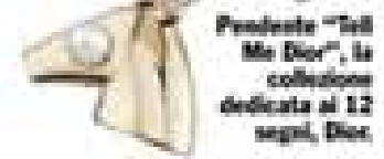
Pendente "Tell Me Dior", la collezione dedicata ai 12 segni. Dior

Rispetto allo scorso anno di questi tempi, ora ti senti un'altra, sia sul lavoro che nei confronti di te stessa. Ci sono grandi transiti. Con Plutone nel segno riprendi contatto con le tue aspirazioni più profonde, sollevando in modo potente le corde dell'inconscio. Il lato sentimentale e passionale emerge, si mostra, si espande. Non vuoi sentirti costretto, forzato, obbligato da nulla. Questioni di cuore Le single stacanoviste del segno non lasciano le giorn. Con il lungo transito di Venere (resta in Capricorno fino al 5 marzo, grazie a un anello di sosta) spogliata da Plutone, basta scivolare in ufficio: sta arrivando (a grande richiesta) una storia coinvolgente, da vivere con una nuova maturità. E con trasgressione qñ (quanto basta). Sarebbe davvero un peccato non approfittarne. Non è neppure esclusa la ricomparsa di un ex. E la scoperta che puoi guardarlo da nuovi punti di vista. Rapporti di lavoro sul filo della seduzione, con scambi di email hot. È tempo di mettere in luce alcuni blocchi interiori che frenano l'espressione della tua femminilità e sensualità. La voglia di mandarli a quel paese adesso ce l'hai. Ti stai focalizzando su quello che sei veramente. E verranno fuori solo belle sorprese.