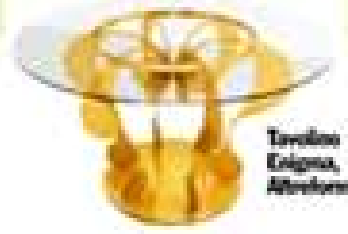
Tavolino Enigma, Altovorm.

Meraviglia: l'insicura concettiva va avanti con le proprie forze e a testa alta! Sei carica, hai voglia di lanciarti in progetti ambiziosi. In questi due anni hai fatto la rivoluzione. Con Giove che rifa per te da mesi e il professor Saturno in trigono stai dimostrando quanto vali. Questioni di cuore Un netto momento di buoi. Dai e riceviti (senza tenere il conto). Se sei single, firta con un solido Capricorno, meno severo di quello che pensi. Ti sorprenderi con coccole e tenerezze. Meglio di una spa!