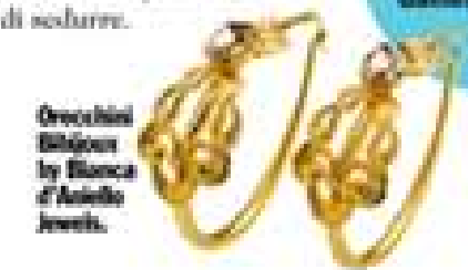
Orecchini Bibigon by Bianca d'Asiello Jewels.

Non succede molto. E lo stand-by non ti esalta: tu hai bisogno di uno skyline fatto di portature e inizi senza fine. Consigliati almeno un weekend low cost con una amica che ti coprirà senza parlare. Questioni di cuore Poca voglia di amareggiare. Reagisci. Firta con un Gemelli o un Bilancia. O tutti e due? Mandi un sms a quel Leone conosciuto al super. Forse non sarà l'amore (con l'A maleduca (non è questo il mese per cercarlo!) ma sarà sufficiente a ridarti fiducia nella tua capacità di sedurre.