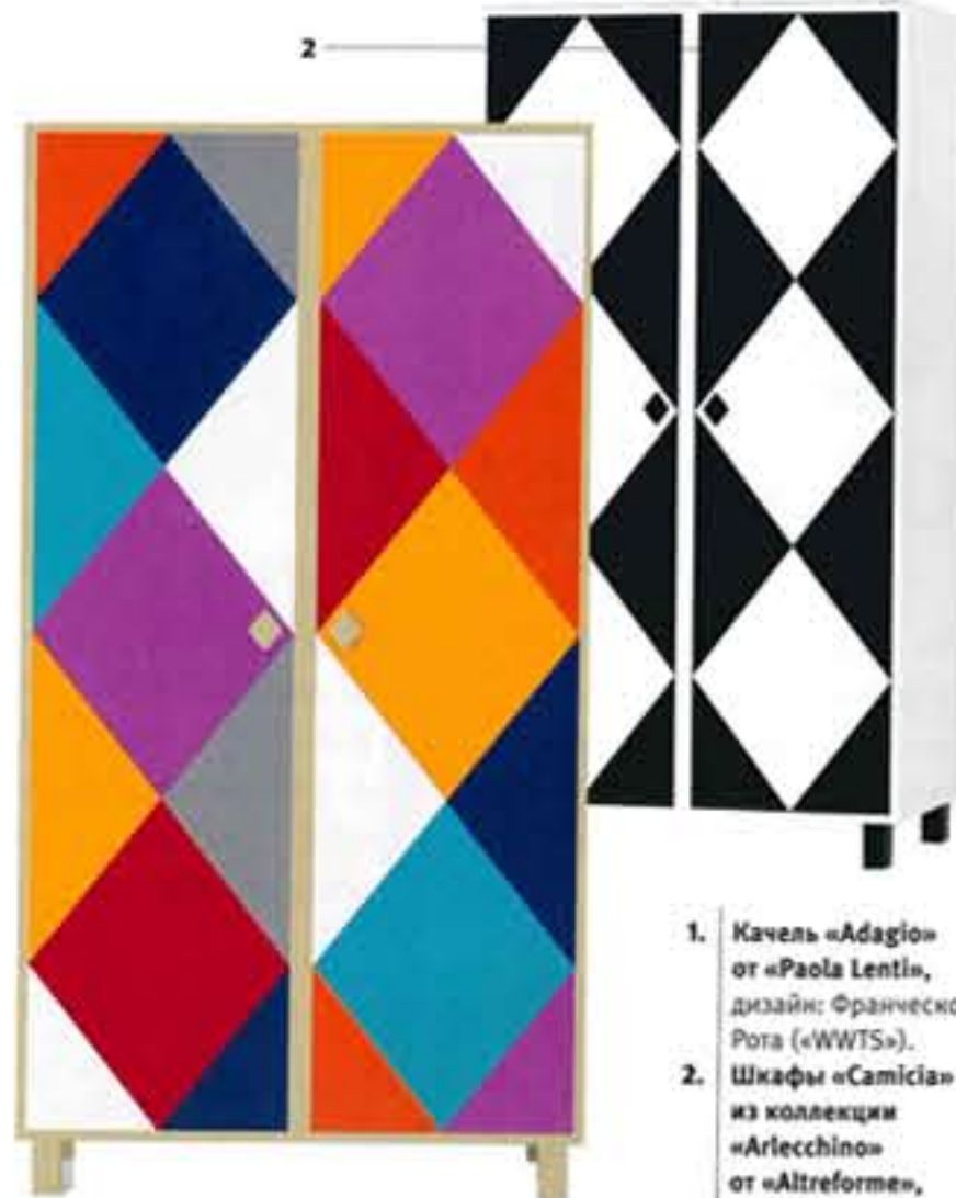
1. Ковель «Adagio» от «Paola Lentini», дизайн: Франческо Рота («WWTS»).