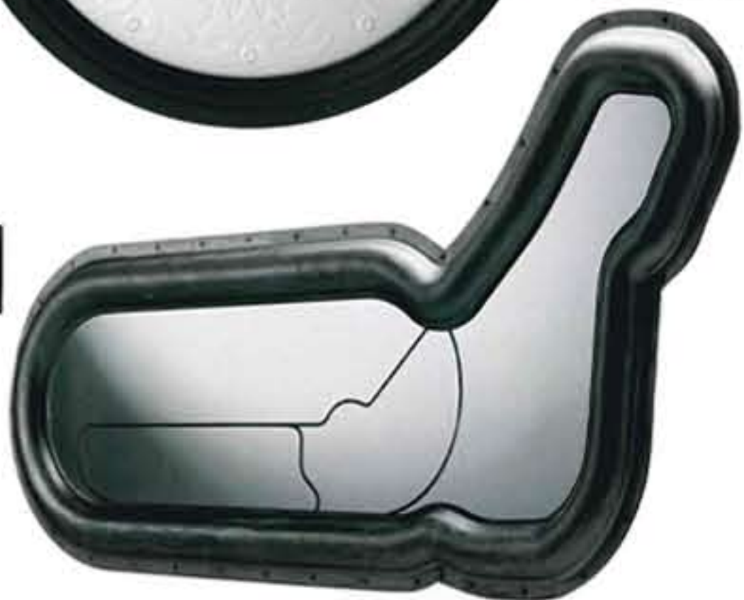
Зеркало «Monza» от «Altreformen», дизайн: Валентин Фонтана («WWTS»).