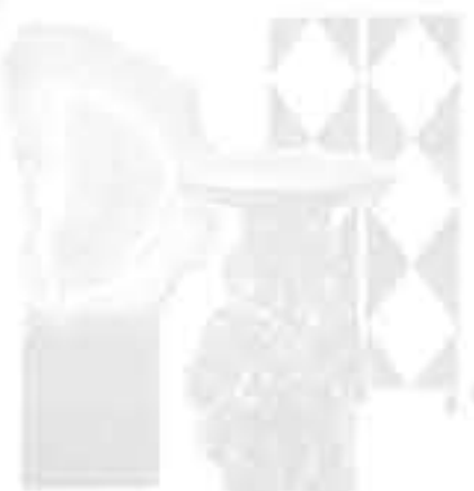
Настольная лампа «Twiggy» размера XL от «Pieter Adam» («Галерея Интерьеров AURUM», 1 890 евро).