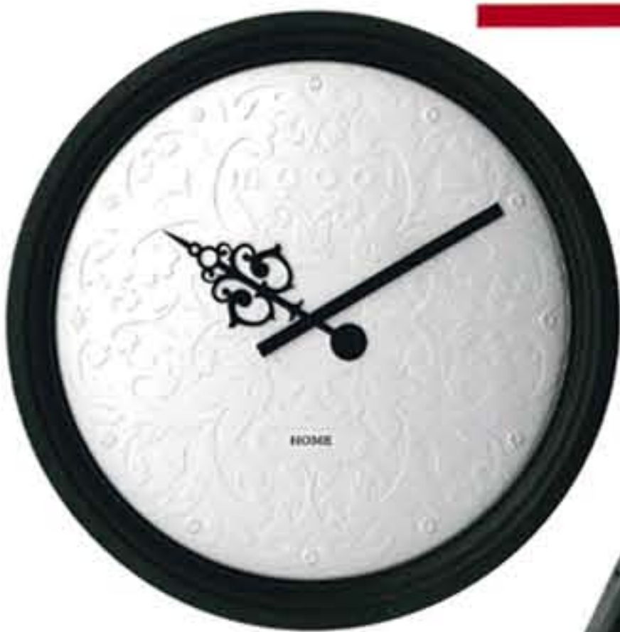
Часы «Big Bell» от «Moool» действительно «big» – их диаметр 180 см! Дизайн: Марсель Вандерс («Интерьеры Экстра Класс», 6 970 евро).