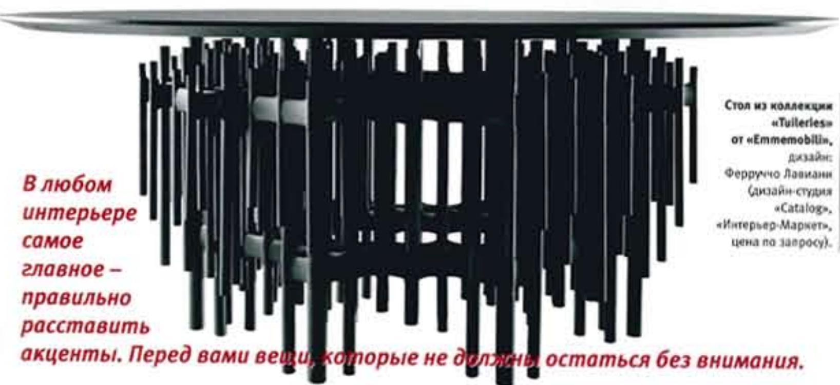
Стол из коллекции «Tulleles» от «Emmeobilli», дизайн: Ферруччо Лавинни (дизайн-студия «Catalog», «Интерьер-Маркет», цена по запросу).

В любом интерьере самое главное – правильно расставить акценты. Перед вами вещи, которые не должны остаться без внимания.