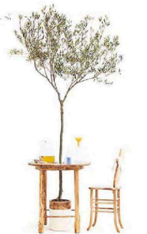
In questa pagina, in senso orario: Set Degustazione Olio con tavolo e sedia TASTE OF WOOD, autoproduzione (foto F. Zaminga); tavolo Caltagirone per MYOP (foto R. Scibetta); Latta I Tonnaroti per Callipo (foto A. Muscatello); Mata, Riproduzione in Polistirolo per Materia Design Festival / Altreforme (foto A. Muscatello).